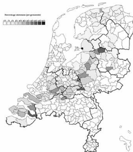
Staatkundig Gereformeerde Partij stem aandeel, 2017

De Bijbelgordel of Protestantenband door het land. De SGP behaalde bij de Tweede Kamerverkiezingen in 2017 2,1% van het aantal stemmen. Per gemeente loopt dat uiteraard uiteen. In de gemeente Urk behaalde de SGP het hoogste percentage (56,1) en in het Brabantse Goirle het laagst (0,0). In gemeenten buiten de zgn. Bijbelgordel komt de SGP vrijwel nergens boven de 1% van de stemmen uit. Een vergelijkbaar kaartje uit 1933 laat nauwelijks verschillen zien, behalve voor bijvoorbeeld Rotterdam en Bunschoten.