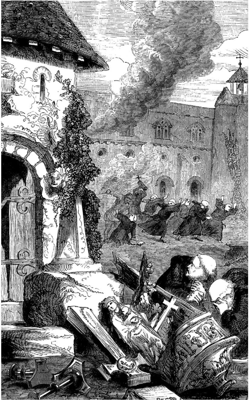
Beeldenstorm in Perth (1559)