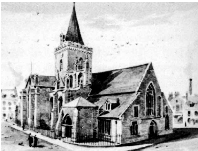
St. John's kerk in Perth

er heel wat aan de kerk veranderd en verbouwd. De Schotse Reformatie is juist in deze kerk begonnen. Het was namelijk de Schotse reformator John Knox die hier op 11 mei 1559 zijn beroemde preek hield tegen de beeldenverering en de vervloekte paapse mis. Toen de predikatie geëindigd was, gingen de mensen rustig uiteen. Slechts een paar nietsnutten bleven in de kerk rondhangen. Zij waren er getuige van dat een priester na de indrukwekkende preek van Knox op provocerende wijze voorbereidingen trof om de mis te bedienen. Toen een jongen daarover wat afkeurende opmerkingen maakte, kreeg hij een klap van de geestelijke. En toen was het hek van de dam. Er werd met stenen gegooid en binnen de kortste tijd werden alle beelden en versieringen in de kerk vertrapt. Een opgewonden menigte deed de rest: 'Spoedig werd het gepeupel door het lawaai aangetrokken. Toen dit volk zag dat er in de kerk niets meer voor hen te doen was, dreef een plotselinge en onweerstaanbare drang hen naar de kloosters. Zij lieten zich niet bedwingen door het gezag van de overheid en evenmin door de overredende taal van de predikanten, die zodra ze van de rellen hoorden erbij gekomen waren. Weldra lagen de huizen van de dominicanen en het kostbare gebouw