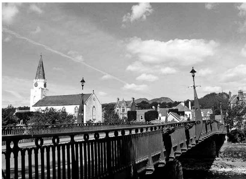
Gezicht op Comrie