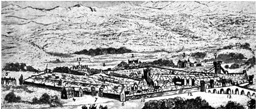
Stadsgezicht van Perth begin 16 e eeuw

De St. John's Kirk is in Perth het oudste gebouw (1126). In 1924 werd de kerk voor het laatst gerestaureerd, als blijk van respect voor de slachtoffers van de Eerste Wereldoorlog. Tussen 1126 en 1924 is