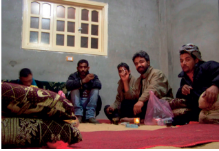
Theedrinken met smokkelaars in de Sinai.