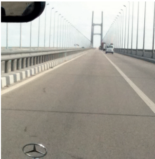
Per taxi over de brug bij het Suezkanaal.

M'n medepassagiers blijven er onbewogen onder. Dit is Egypte. Voorin, naast de chauffeur, zit de enige dame van het gezelschap. Een ongeluk of niet, zij gaat gewoon verder met haar telefoongesprek, haar mobiel vastgeklemd tussen haar oor en haar hoofddoek – handsfree zonder bluetooth of andere technische snufjes. De chauffeur, met baard, is zelf ook voortdurend in gesprek met raadselachtige neven her en der in het land. En is hij even niet aan het bellen, dan zet hij, op standje tien, een bandje met Koranrecitaties op. Een cd-speler bezit de Mercedes niet.