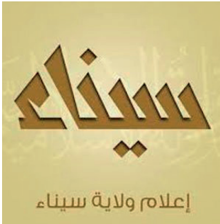
IS-logo van 'provincie Sinai'.

Maar hun hardheid, en dat is het verwarrende van spreken met terroristen of potentiële terroristen, gaat nooit ten koste van de gastvrijheid voor wie het aandurft met hen op