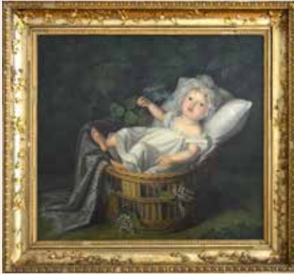
Prinses Marianne in de wieg. Geschilderd in 1811 door haar moeder, Wilhelmina van Pruisen. Muzeum Powiatowe w Nysie (Polen), 2019.

favoriete thema's. In de periode na 1814 komt de bekende Pruisische hofschilder Friedrich Bury uit Berlijn naar Brussel en Den Haag om haar les te geven.