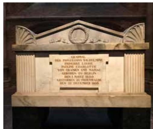
In de Nieuwe Kerk in Delft staat het grafmonument voor prinses Pauline, dochter van koning Willem I en koningin Wilhelmina. Dit monument is afkomstig van haar oorspronkelijke graf in Freienwalde (Duitsland) waar zij in 1806 is begraven.

Op 12 oktober overlijdt ze op Paleis Noordeinde. Haar lichaam krijgt op 26 oktober een plaats in de koninklijke grafkelder in Delft. De herdenkingsdienst, met hofprediker Isaäc Dermout als voorganger, wordt op de daaropvolgende zondag 29 oktober 1837 in de Kloosterkerk in Den Haag gehouden.