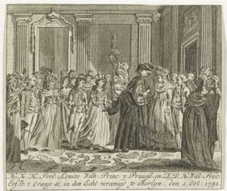
Huwelijkssluiting op 1 oktober 1791 in de Witte Zaal van het Stadtschloss in Berlijn, tussen erfprins Willem Frederik (de latere koning Willem I) en prinses Wilhelmina van Pruisen. Anoniem (1791). Rijksmuseum, Amsterdam.

Mimi brengt een groot deel van haar jeugd in Berlijn door. Ze is kunstzinnig, muzikaal, speelt graag toneel en kan goed schilderen. Als Mimi zestien jaar oud is, wordt ze uitgehuwelijkt aan de Nederlandse erfprins Willem Frederik, de latere koning Willem I. Op 1 oktober 1791 treedt ze met hem in het grote stadspaleis in Berlijn in het huwelijk. Aansluitend volgt daar een bruiloftsfeest dat maar liefst zeventien dagen duurt. Daarna vertrekt het jonge paar naar Den Haag. Op 2 november 1791 wordt het paar daar feestelijk binnenge-