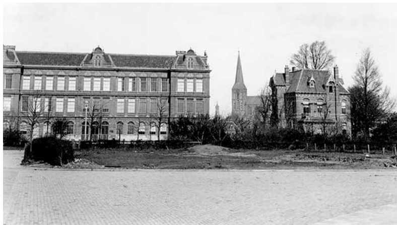
Johannes Calvijn Lyceum in Kampen (voorheen gereformeerd gymnasium).