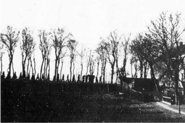
Begravenisstoet op de Blokhuisweg bij het Armenhuis op weg naar de begraafplaats.

namen dragen: Beens, Last, Van Dijk of Van Dalfsen. Waar ieder wel ergens familie is van de ander en waar meestal de bijnamen het onderscheid moeten maken.