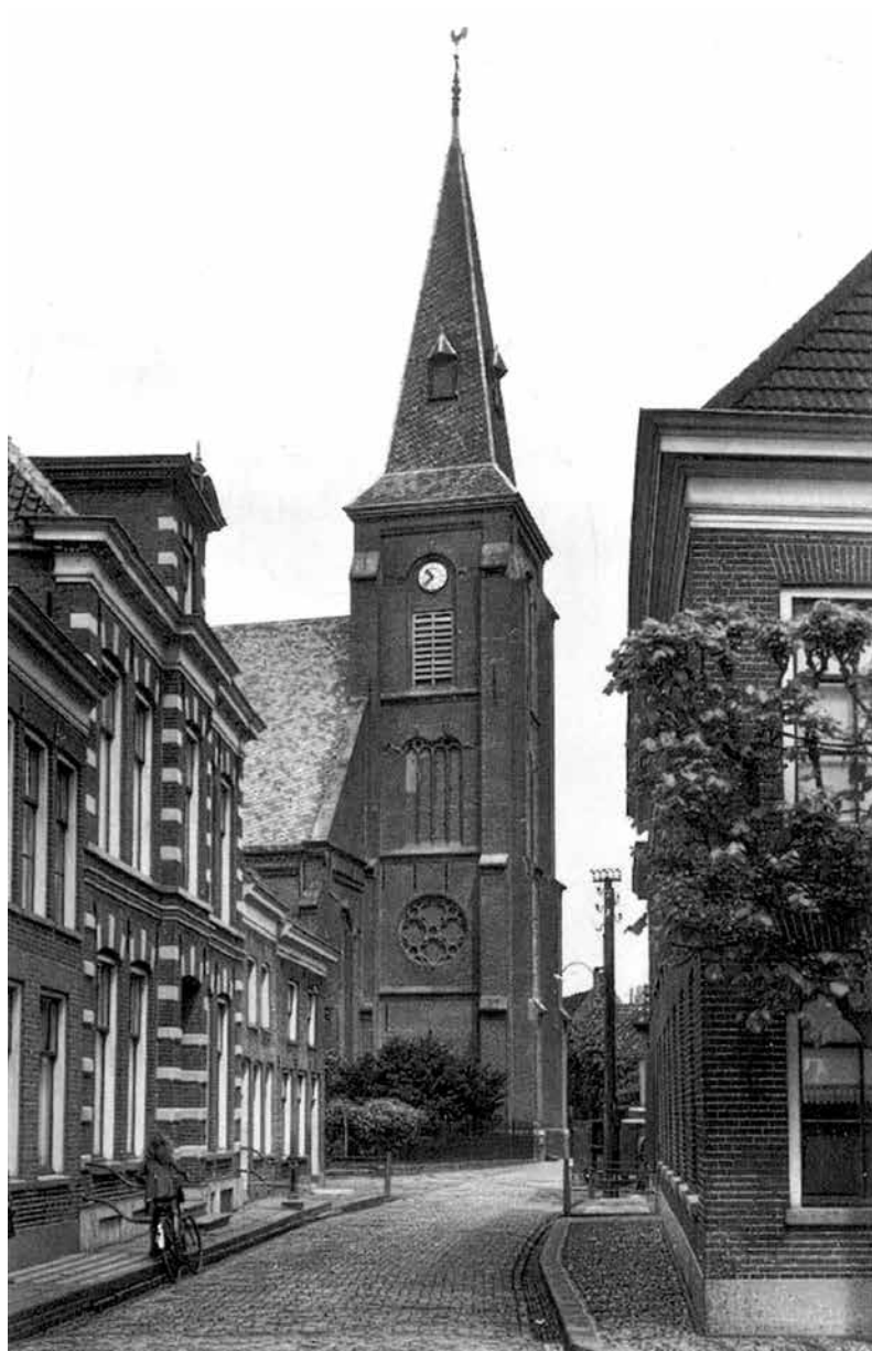
Hervormde kerk Genemuiden, met links de pastorie.