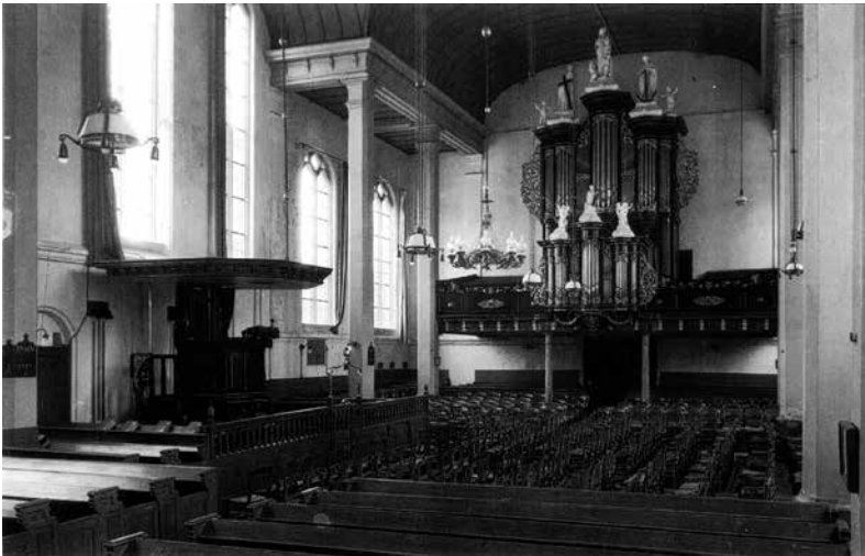
Interieur van de Hervormde kerk Genemuiden, rond 1950.